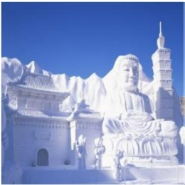
თოვლის ფესტივალი საპოროში

ჰოკაიდოს რეგიონი მდებარეობს იაპონიის ოთხი ძირითადი კუნძულიდან ერთერთზე, სიდიდით მეორე და ჩრდილოეთით მდებარე კუნძულ ჰოკაიდოზე და ასევე მოიცავს რამდენიმე მიმდებარე პატარა კუნძულს. ჰოკაიდო სამხრეთიდან კუნძულ ჰონშუსგან გამოყოფილია ცუგარუს სრუტით (ჰოკაიდო ჰონშუს უკავშირდება წყალქვეშა გვირაბში გამავალი სარკინიგზო ხაზით). ჰოკაიდოს კლიმატი საგრძნობლად განსხვავდება დანარჩენი იაპონიის კლიმატისგან. ზაფხულისთვის ზოგადად დამახასიათებელია სიგრილე, ხოლო ზამთარი სუსხიანია. ჰოკაიდოზე განფენილი მთაგორიანი მასივი გამოირჩევა ბუნებრივი სილამაზით, პირველქმნილი ტყეებით, მოქმედი ვულკანებითა და დიდი ტბებით. აღმოსავლეთ ჰოკაიდოში მდებარე კუშიროს ჭანჭრობი ცნობილია, როგორც სამოთხე გადამფრენი ფრინველებისთვის, კერძოდ, იაპონური წითელბიბილოიანი წეროებისთვის. 2005 წელს მსოფლიო მემკვიდრეობათა ნუსხას დაემატა ჰოკაიდოს ჩრდილო-აღმოსავლეთით მდებარე შირეტოკოს ნახევარკუნძულის გარკვეული ნაწილი. ჰოკაიდოზე პირველი დასახლება უკვე XVI საუკუნეში გაჩნდა, როდესაც იაპონელებმა ადგილობრივ ინუ მოსახლეობასთან სავაჭრო ურთიერთობები წამოიწყეს, თუმცა კუნძულის ფართომასშტაბიანი განვითარება XIX საუკუნის ბოლოს, მეიჯის მთავრობის მიერ დაიწყო.