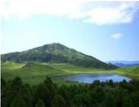
ასოს მთა კუმამოტოს პრეფექტურაში

ჩიუგოკუს მთაგორიანი რეგიონი გარს ევლება ჰონშიუს კონცხის დასავლეთ ნაწილს და გამოირჩევა მცირე აუზებითა და ზღვისპირა დაბლობებით. ხმელეთის შიგნით განლაგებული ზღვის სანაპირო ზოლის ნაწილი მრეწველობისა და კომერციის მნიშვნელოვანი ცენტრი და ამ რეგიონის ყველაზე მჭიდროდ დასახლებული პუნქტია.