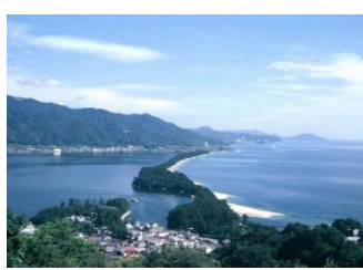
ამანოჰაშიდატე კიოტოს პრეფექტურის ჩრდილოეთში

იაპონიის მრეწველობის მხრივ მეორე ადგილზეა კინკის რეგიონი, რომელიც მდებარეობს კუნძულ ჰონშიუს ცენტრალურ დასავლეთ ნაწილში. კინკიში მდებარეობს იაპონიის ძველი დედაქალაქი კიოტო. აქვეა ქალაქები ოსაკა და კობე (იაპონიის უმნიშვნელოვანესი პორტი), რომელიც წარმოადგენს დასავლეთ იაპონიის კომერციულ ცენტრს. ბრინჯისა და ციტრუსის წარმოებას, ტყის საექსპლუატაციო სამუშაოებსა და მეთევზეობას მნიშველოვანი წვლილი შეაქვს რეგიონის ეკონომიკის განვითარებაში.